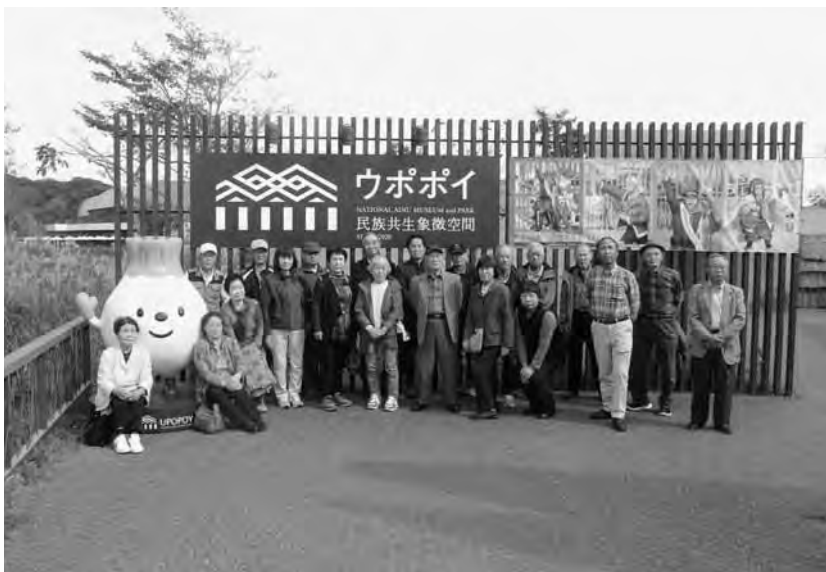
仲間との楽しい思い出づくり

2日目は午後から白老町のウポポイを訪れ、伝統芸能を鑑賞するなど、アイヌの歴史や文化にふれ、一行は1泊2日の全行程を終え帰路についた。