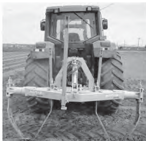
写真2 カットブレーカーの施工