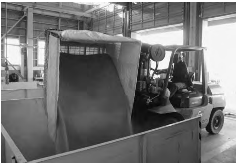
スムーズに受け入れ作業を進める