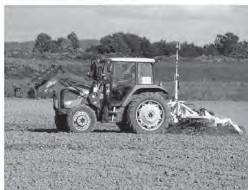
写真4 レーザーレベラーの施工