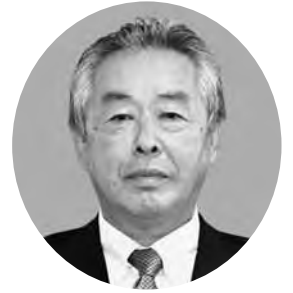
北海道農業協同組合中央会