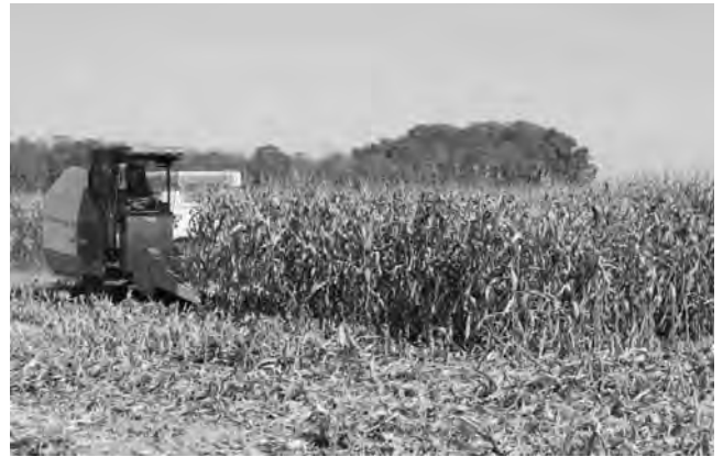
順調に収穫を進める

村内では子実コーンの栽培に取り組んでいる生産者らが10月8日から収穫作業を進めた。