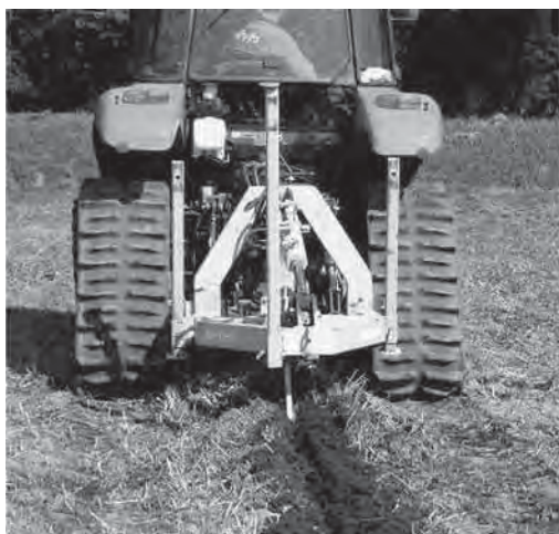
写真1 カットドレーンの施工