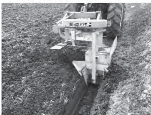
写真3 額縁明きよの施工